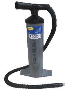
※フットポンプは別売りとなります