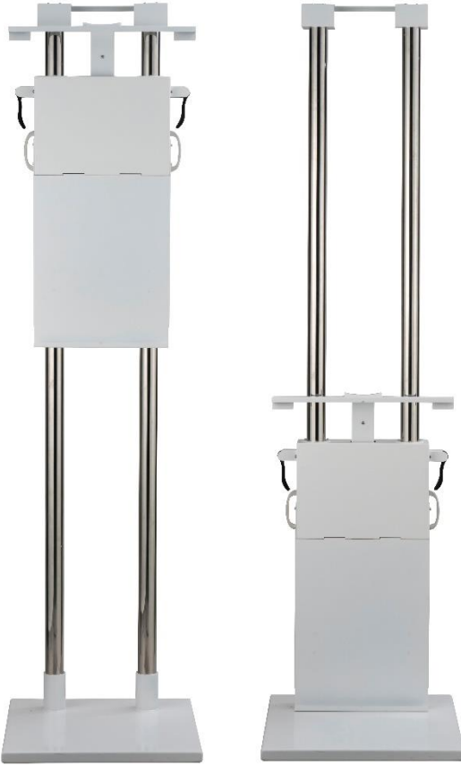
< ez-L 床置き >