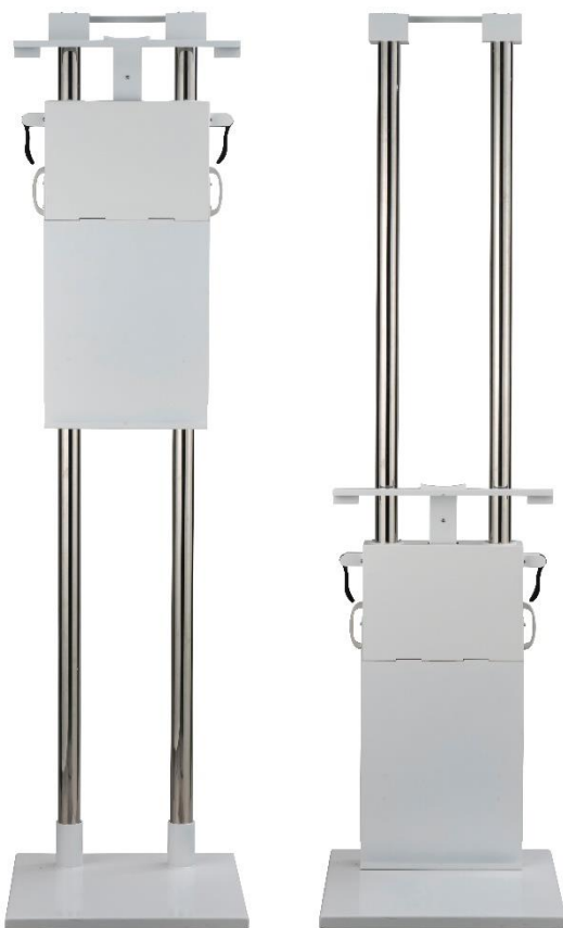
&lt; ez-L 床置き &gt;