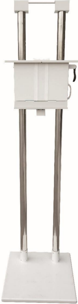
&lt; ez-F 床置き &gt;