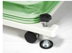
●キャスター・アジャスター