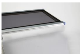
●アルミフレームカバー