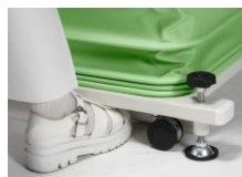
・つま先が入るスペースを確保