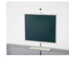
●側面カセットホルダ