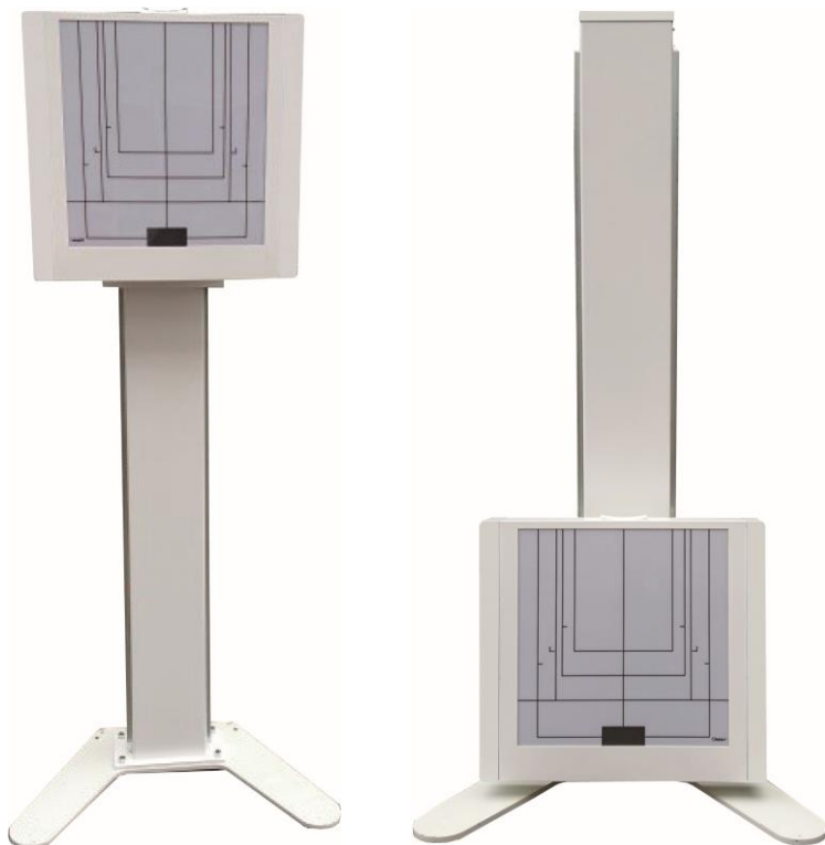
< 最上位 >